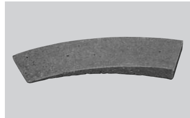
ACO KLIN Typ A – dla podwyższania wężu w granicach 2,5 do 3,5 cm

W celu wypełnienia szczeliny podwyższającej wąż studzienki do wymaganego poziomu, w granicach od 2,5 do 5,5 cm, należy zastosować odpowiednią kombinację klinów obu typów.