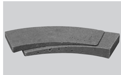
Połączenie ACO KLIN Typ A i ACO KLIN Typ B dla podwyższania wężu w granicach 3,5 do 4,5 cm.